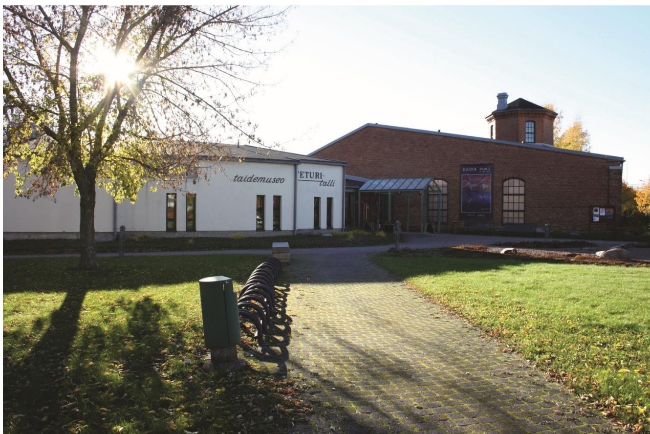
Kuva: Teija Ala-Rakkola, 2018